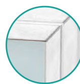
CON CORNICE BIANCA